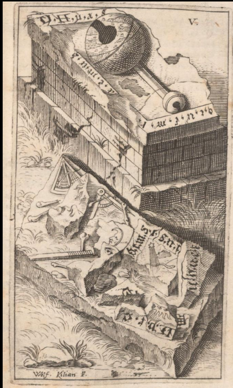
Jacob Balde, Poema de vanitate mundi , München 1638