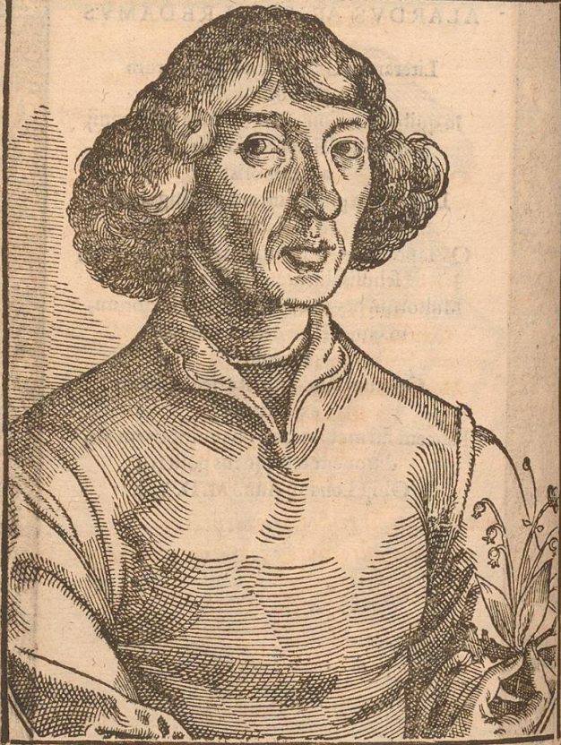
NICOLAUS COPERNICVS Mathematicus.

Quid tum? si mihi terra mouetur, Solq, qui escit, Ac caelum: consistit calculus inde meus.